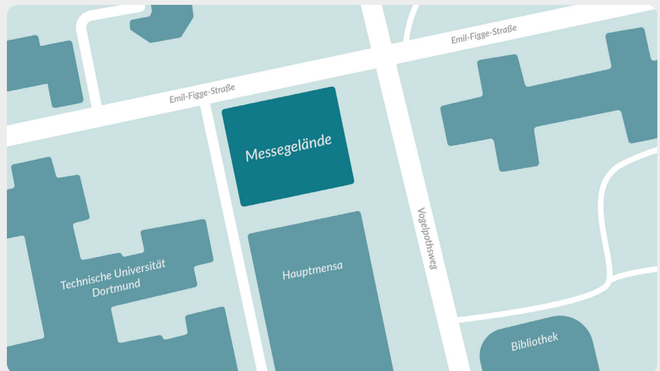
Messegelände: Neben der Hauptmensa | Emil-Figge-Straße / Vogelpothsweg

Sprechen Sie potenzielle Arbeitnehmer:innen an, noch bevor diese den Arbeitsmarkt erreichen. stellenwerk bringt Sie direkt auf den Campus der TU Dortmund.